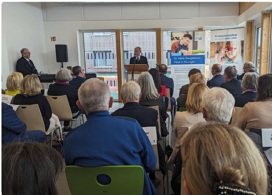
Einweihung des Dr. Hans Neugebauer-Haus in Kitzingen